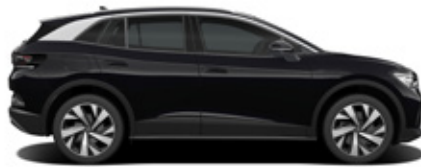
Grenadilla Black Metallic / Black Roof