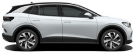
Glacier White Metallic / Black Roof