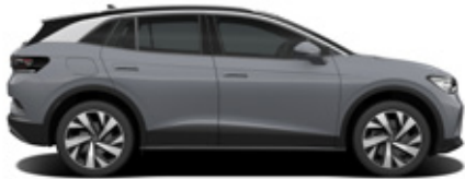
Moonstone Gray / Black Roof