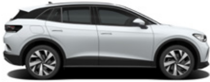
Glacier White Metallic