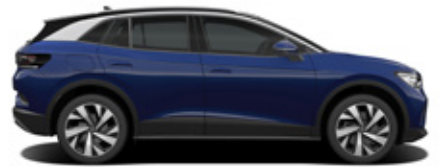
Blue Dusk Metallic / Black Roof