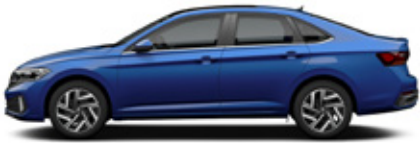
Rising Blue Metallic