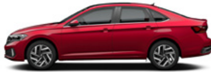
Kings Red Metallic