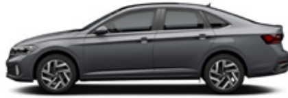
Platinum Gray Metallic