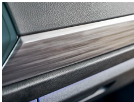
Sliced Metal Brush