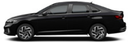
Deep Black Pearlescent