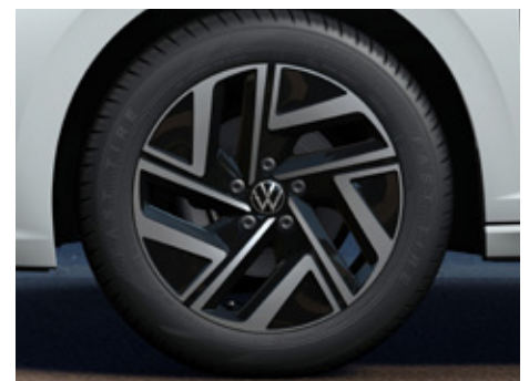
7J x 17" alloy wheels 205/55 R17 tyres